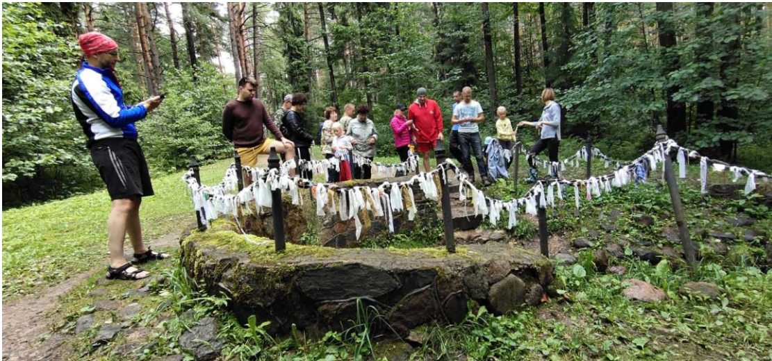
5. Активные игры на свежем воздухе.